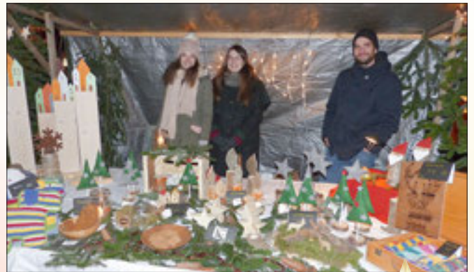
Viele schöne Sachen zum Verschenken...