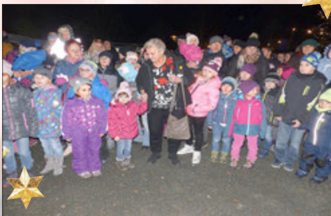
Artig warten die Kleinen mit ihren Eltern und Großeltern.