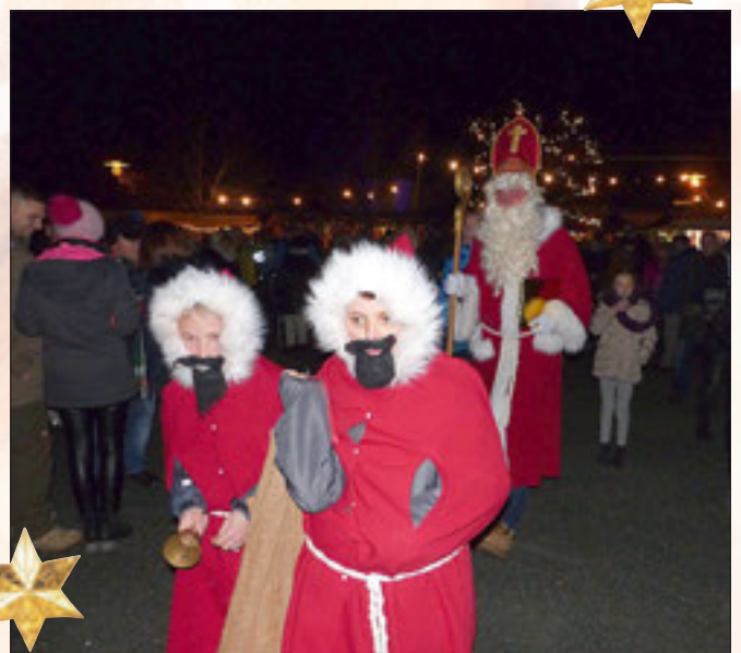
Der Nikolaus hält mit seinen Zwergen Einzug.