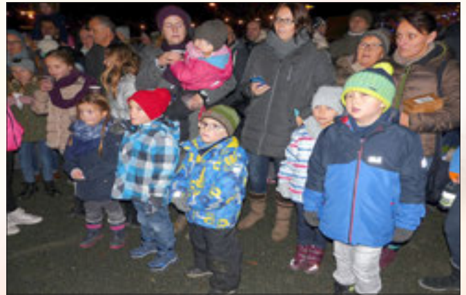
Aufmerksam lauschten die Kinder den Worten des Pelzmärteis.