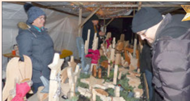
Holzdekoartikel in großer Auswahl...