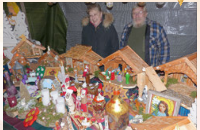
Krippen aus Handarbeit...