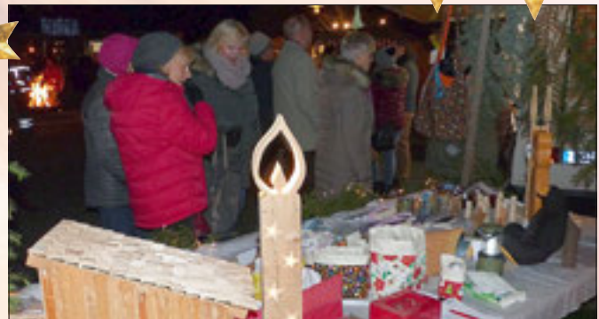
Dicht umlagert waren die reichhaltigen Auslagen der Stände.