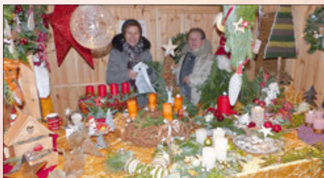
Vieles, was das Herz begehrt. Was darf's denn sein?