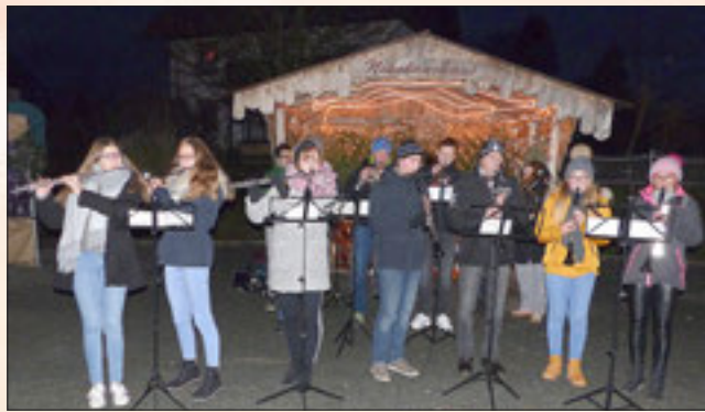
Der Musikverein Marktlegast spielte mit adventlichen und weihnachtlichen Weisen auf.