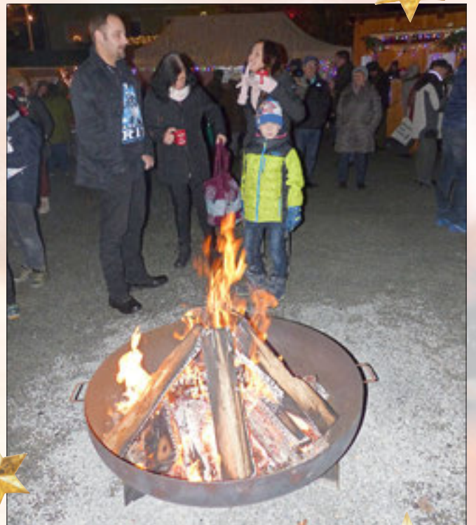
Ein Pläuschchen an der Feuerschale.