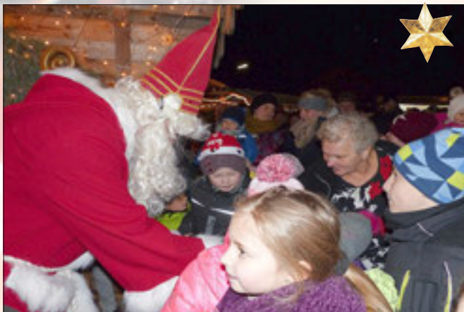
Ein Schokoladennikolaus für die Kinder vom Nikolaus.