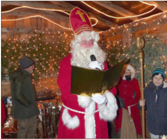
Viel Gutes stand im Goldenen Buch.